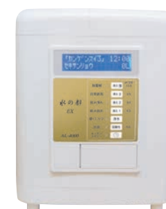
水の都 EX AL-4000